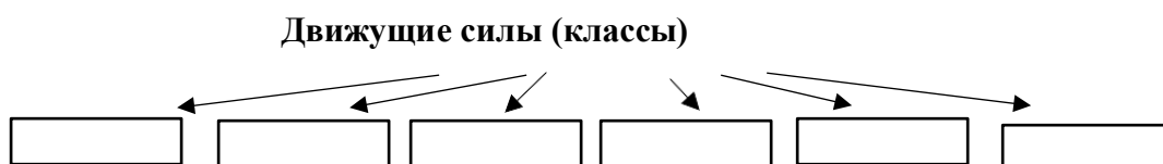
Схема. Движущая сила Февральской революции 1917 года

Класс-гегемон (класс-руководитель данной революции): _____